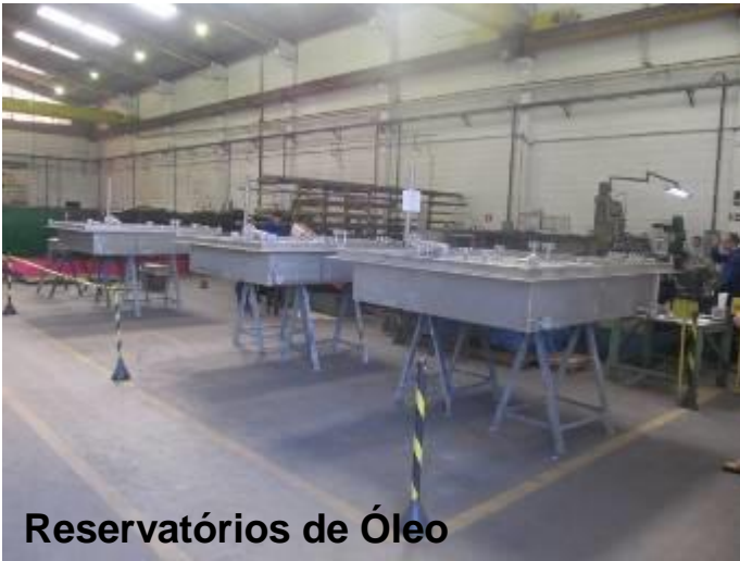
Reservatórios de Óleo