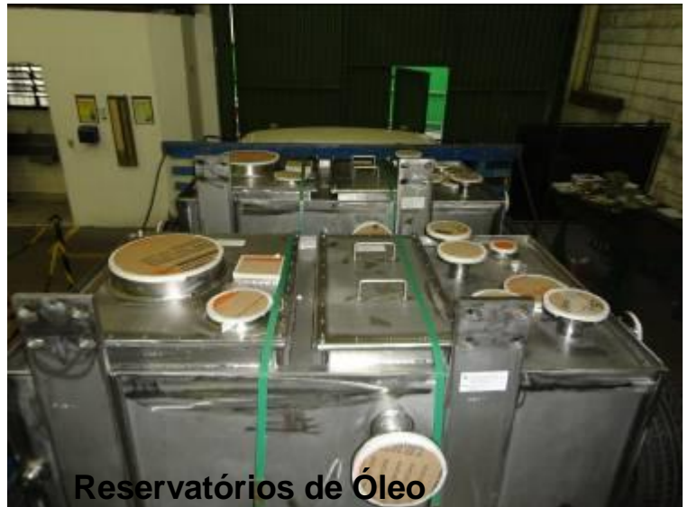
Reservatórios de Óleo