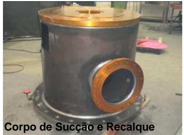
Corpo de Sucção e Recalque