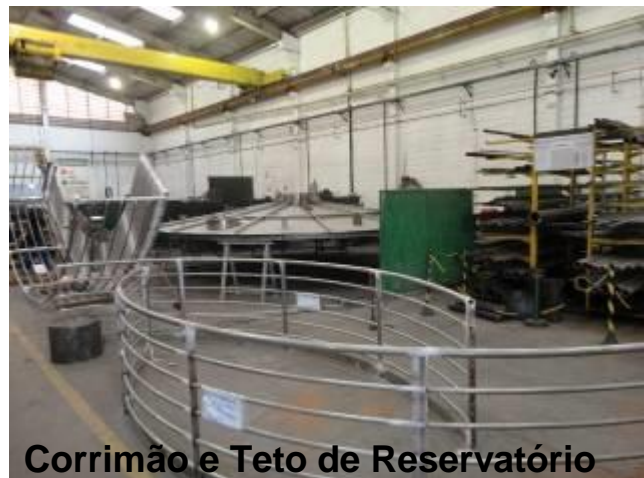
Corrimão e Teto de Reservatório