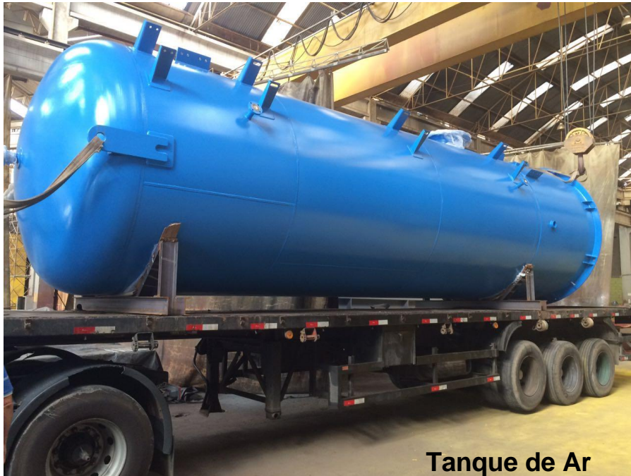
Tanque de Ar