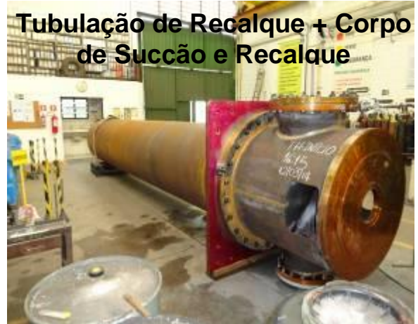
Tubulação de Recalque + Corpo de Sucção e Recalque