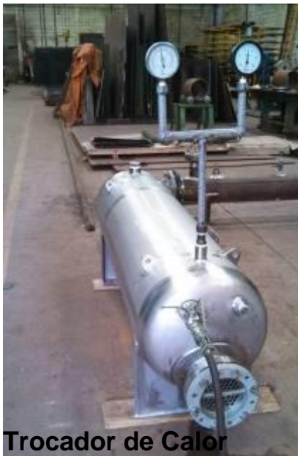
Trocador de Calor