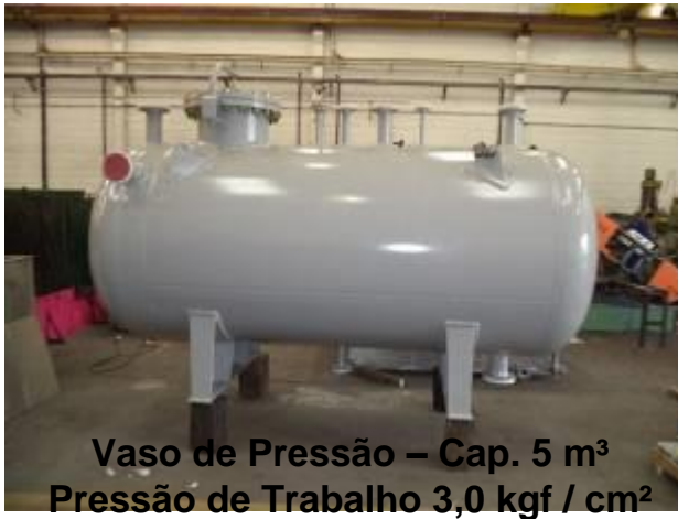
Vaso de Pressão – Cap. 5 m 3 Pressão de Trabalho 3,0 kgf / cm 2