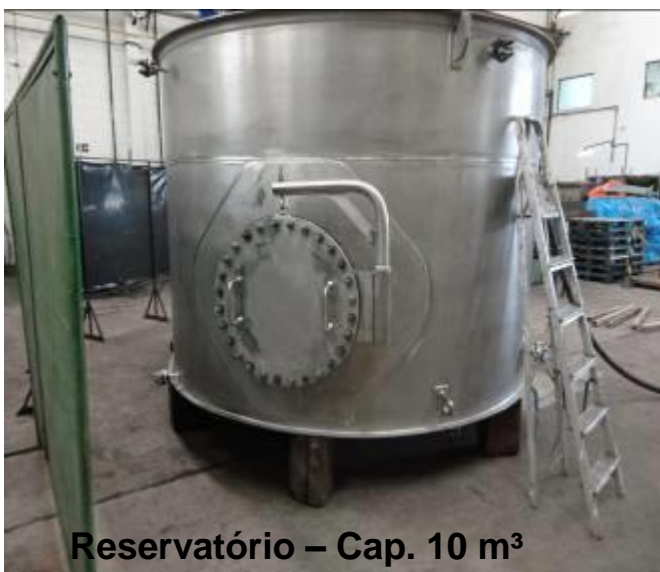
Reservatório – Cap. 10 m 3